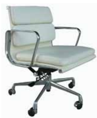
sofa pad management chair