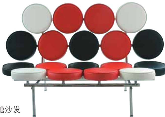
Marshmallow Sofa 棉花糖沙发

谈到经典家具设计,很多人都会想到欧洲国家的设计师。美国,除了Eames夫妇,就是George Nelson。选他为第一期的代表人物,不是因为一看就叫人倍感亲切的椰子椅,而是他的经典时钟设计,经得起时间的考验。