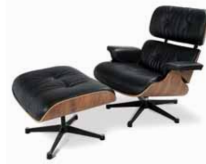
eames lounge chair