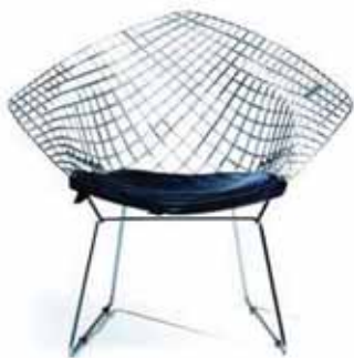
bertoia diamond chair