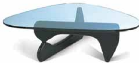
norguchi coffee table