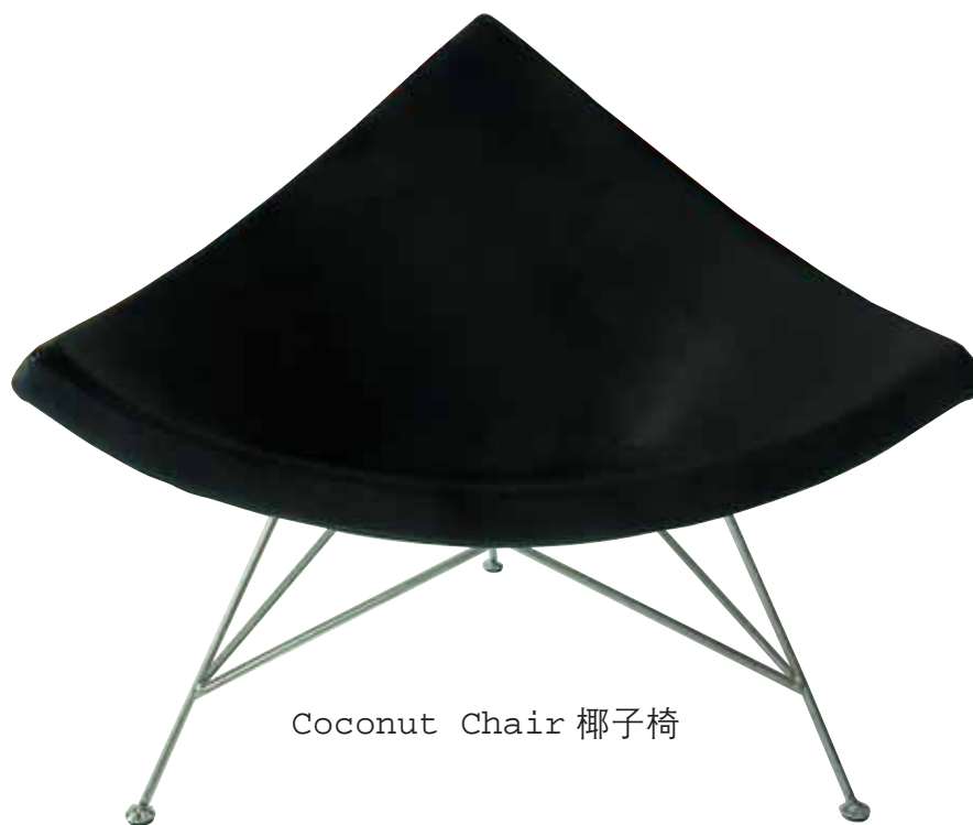
Coconut Chair 椰子椅