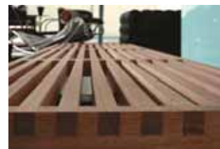
Platform Bench 经典长凳