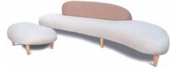
NI Sofa & Ottoman