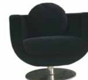
Tulip Arm Chair