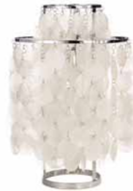
LT0012 Table Lamp