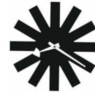
CW 07 Wall Clock