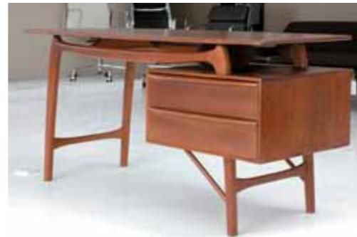
空间里的光影，设计里的材质纹理