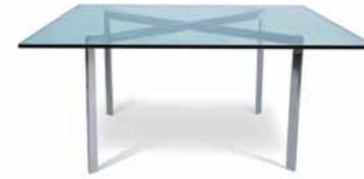
CT3004 Coffee Table