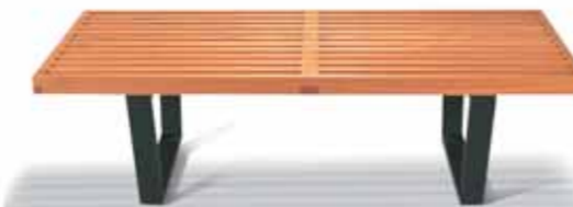
NI Wooden Bench